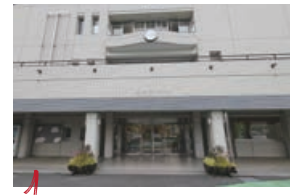
1 皆野町役場 ここで電動自転車を借りよう!

埼玉県秩父郡皆野町皆野1420-1 ☎0494-62-1462 (皆野町産業観光課) 🕒9:00~17:00 ※最終受付15:00 📅年末年始 ※12/29~1/3 🚶皆野駅から徒歩7分