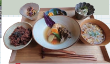
5 里カフェ 心と身体が喜ぶごはん で免疫力向上!

埼玉県秩父郡皆野町皆野4048-1 ☎0494-62-1688 🕒9:00~16:30 🔥火曜 ※祝日の場合は翌日休園、冬季休業あり 👉500円(整備協力金・中学生以上)