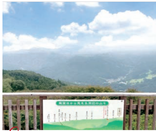
2 美の山公園 展望台からの景色は圧巻!

標高586.9mの独立峰。秩父盆地と山々が一望でき、運が良ければ雲海の幻想的な景色を見ることが出来る。 埼玉県秩父市黒谷