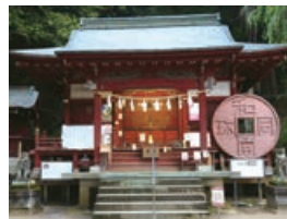
3 聖神社 金運上昇のご利益!

日本最初の貨幣である和同開珎ゆかりの神社。「銭神様」とも。 埼玉県秩父市黒谷2191 ☎0494-24-2106