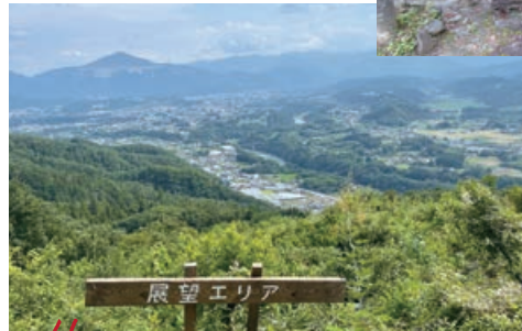
4 リトリートフィールド Mahora稲穂山 自然に身を委ねてリトリートを体験!

山頂の展望エリア、里カフェ、森の美術館、キャンプ場、体験工房、秩父で最大最古の古墳である稲穂山古墳などの他、パワースポットや撮影スポットとして人気の「岩の広場」がある。リトリートを体感しよう。