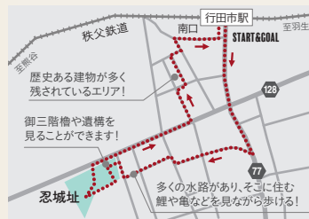
埼玉県行田市本丸17-23 ☎048-554-5911(行田市郷土博物館) 行田市駅南口から徒歩15分