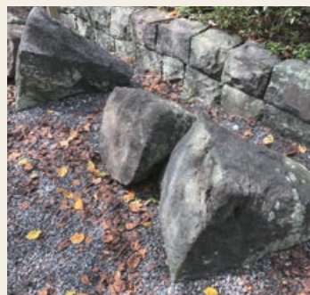
遺構：石垣に使われた間知石(けんちいし)