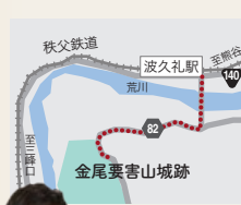
別名「つつじ山」。毎年4~5月にかけて山につつじの花が咲く。山頂の展望台からは寄居・長瀬方面が一望！ 埼玉県大里郡寄居町金尾 波久礼駅から徒歩20分