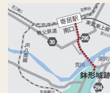
長尾景春が築城し、北条氏邦が改修した戦国時代の代表的な城郭跡。鉢形城公園として整備され、当時の様子を垣間見ることができる。 埼玉県大里郡寄居町鉢形2692-2 ☎048-586-0315(鉢形城歴史館) 寄居駅南口から徒歩25分