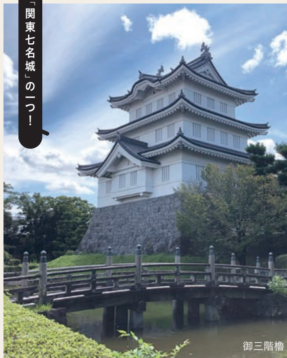
「関東七名城」の一つ！

15世紀後半、成田氏が築城。豊臣軍の水攻めに耐え抜き「浮き城」と呼ばれる。1988年に行田市郷土博物館の開館にあわせて御三階櫓が建てられた。忍城址公園内には移築門や本丸土塁、間知石(けんちいし)などの遺構がある。