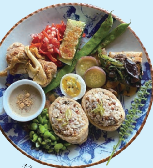
※ランチメニューイメージ