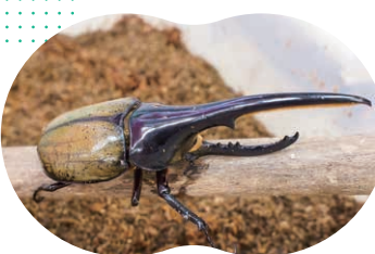
ヘラクレスオオカブトを販売します