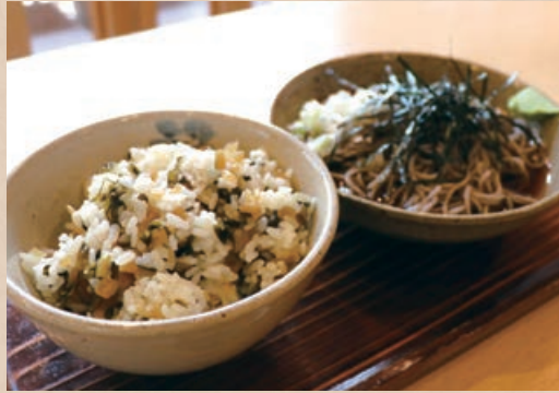
しゃくし菜めしセット 1,200円(そばorうどん/温or冷)

初代女将が考案した看板メニュー。「しゃくし菜漬」の混ぜご飯とそばなどが選べるお得なセット。漬物の酸味が効いていて、食欲が出ない夏でもさっぱりと食べられる。