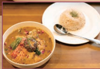
マッサマンカレー 1,780円 ※パーティタイムのみ 「世界一おいしい」と言われるタイカレーをアレンジ。出汁で煮込んだ野菜がたっぷり!

スパイスの効いたスープに季節の野菜をたっぷり、メインとトッピングを選んで、辛さは……。考えるだけで楽しくなるスープカレーは、北海道名物として人気。秩父においても、地元食材を活かし、よりヘルシーにアレンジを加えたスープカレーを楽しめるのが「パラダイスアレイ」。カウンター6席の小ぢんまりとしたダイニングバーで、ランチタイムはスープカレー、パーティタイムにはマッサマンカレーなどを提供する。秩父の新名物になる日も近いかも?