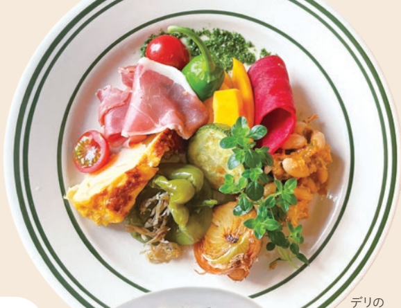
デリの 盛り合わせ 1,500円

台所や協力のもと、SLパレオエクスプレスでしか 味わえない「SL弁当」販売中! 詳細はP11へ!