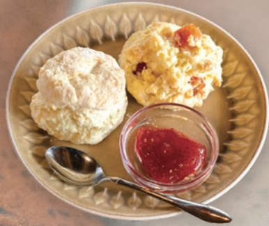
スコーン(2piece) 700円 外はざっくり、中はふわふわ。 ドライマトのアクセントが素敵