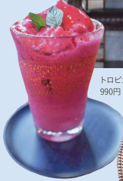
トロピカルスムージー 990円

埼玉県秩父市上野町8-10 ☎0494-53-8016 ☎12:00～ ※完全予約制 🕒月曜～木曜 📍秩父駅から徒歩5分