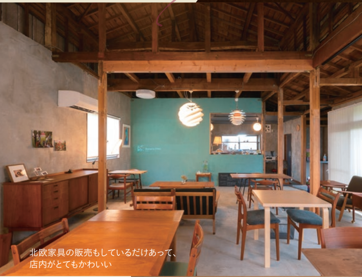
北欧家具の販売もしているだけあって、 店内がとてもかわいい