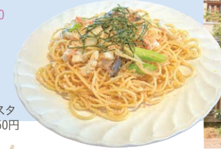
いかとタラコの pasta 950円

埼玉県秩父市宮側町2-10 ☎0494-24-7706 🕒10:00～19:30 🕒月曜 📍秩父駅から徒歩4分