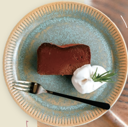
ショコラテリーヌ 650円 ビターチョコをふんだんに 使ったチョコ好きにはたまら ない逸品