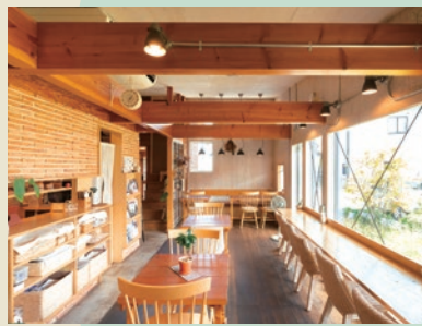
素敵な庭を眺めながら優雅な時を