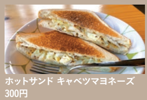
ホットサンド キャベツマヨネーズ 300円

チーズケーキ 300円 オープンではなくフライパンで焼いたチーズケーキは、素朴かつ個性光る逸品。レモンを効かせたさっぱり感があり、コク深いコーヒーと一緒に味わうのがおすすめ。