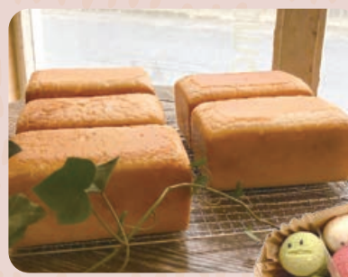
米粉パン 800円 増粘剤不使用のグルテンフリー米粉食パン