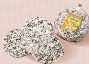
行田ポンせんべい (古代米) 260円