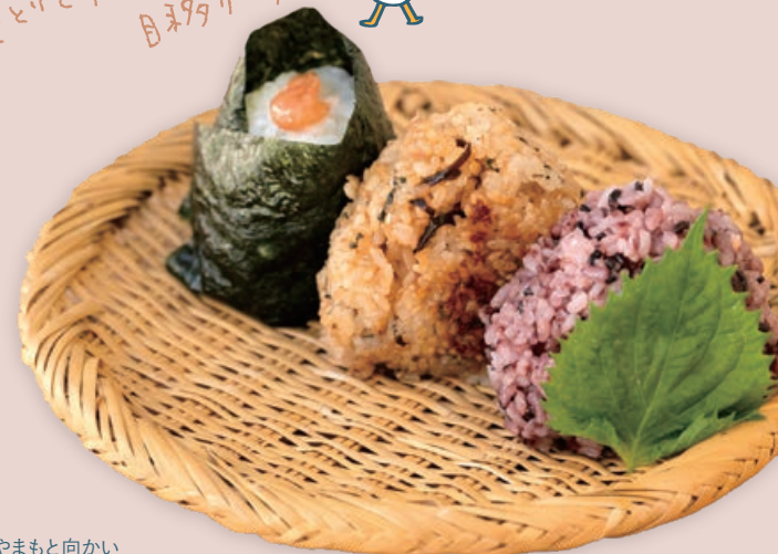
(左から) 和歌山産無添加梅干し 180円 焼きおむすび 200円 黒米しゃけ 250円