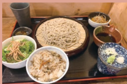
Aランチセット 1,200円(+200円で十割蕎麦に変更可能) 蕎麦はコシのある本格派。二八蕎麦と十割蕎麦を選べる

蔵を改装した店内は清潔感があり落ち着く空間。秩父の郷土料理「かてめし」と本格蕎麦の両方が味わえるAランチがオススメ!「かてめし」は秩父産舞茸を使った、懐かしくもほっとする味。ぜひ一度秩父の味を堪能してみてください。