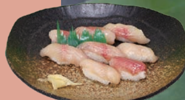
岩魚すし(岩魚握り) 2,970円 脂がのった、ほんのり甘みがある自身の握り