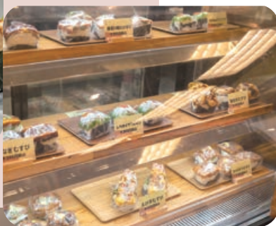
ボリューム満点のラインナップ。 売り切れ必至!