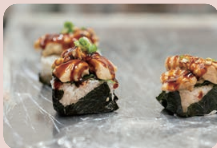
焼き鳥むすび 299円 秩父の伝説的焼き鳥屋の焼き鳥をおむすびに