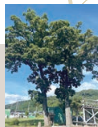
2本の木が寄り添う「夫婦クヌギ」

1884年に農民たちが不平等や不正義に立ち向かった「秩父事件」。蜂起集結の地として知られており、境内には「秩父事件百年の碑」や「秩父事件関係略図案内板」がある。また、秋季例大祭の「龍勢祭」は、五穀豊穡への感謝と無病息災、家内安全を祈り、毎年10月の第2日曜日に開催される。