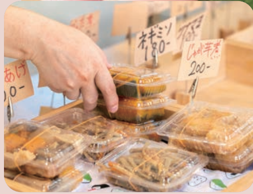
キビ糖やコメ油などを使用し、体に優しい愛情たっぷり手作り惣菜