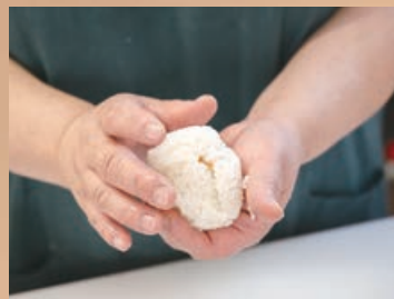
おむすびは優しく手で包むだけ。 ふわふわなのに不思議と崩れない

秩父の名物をおむすびで手軽に食べられる! (左から) 豚味噌むすび 399円 わらじかつむすび 399円 しゃくし菜むすび 299円