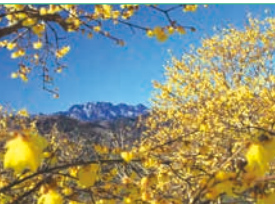
宝登山山頂 (臘梅園)

ハイキングに参加して賞品をもらおう! 🕒 集合駅・受付時間 🚌 旅行代金 🚶 コース／行程