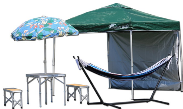
《3大特典》タープテント、テーブル・チェアセット、自立式ハンモック