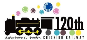
創立120周年記念ロゴマークイメージ

その他、創立120周年記念ロゴマークを使用した商品や各種製作物を展開しています。