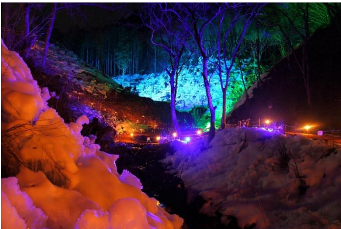
あしがくぼの氷柱イメージ