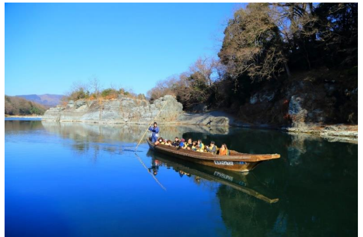
こたつ舟イメージ