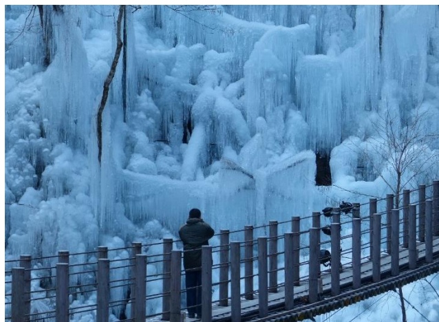
尾ノ内百景氷柱イメージ