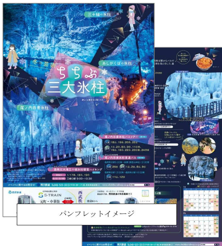
パンフレットイメージ