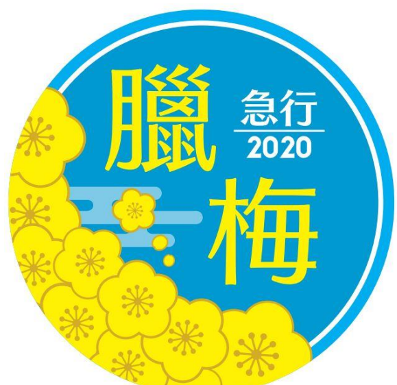
ヘッドマークイメージ