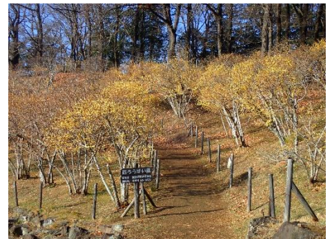
2020 年 1 月 8 日現在の様子

<2020 年 1 月 8 日現在の開花状況> 例年より 1 週間ほど早い開花状況です 西ロウバイ園：2・3 分咲き 東ロウバイ園：咲き始め 四季の丘：1・2 分咲き