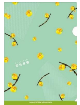
A5 クリアファイルイメージ

■引換条件 秩父鉄道公式Instagramアカウントフォロー画面をご提示ください 秩父鉄道フルラッピングトレイン第3弾「彩色兼備」のクリアファイルをプレゼントします