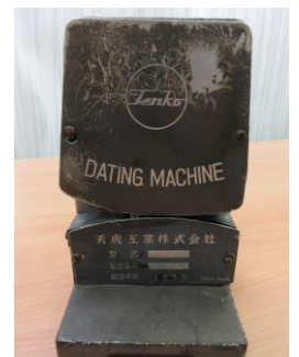
日付印字器（ダッチングマシン）

※2020年1月25日（土）～3月1日（日）発売の「ロウバイ記念急行券」は西暦表記の日付印です