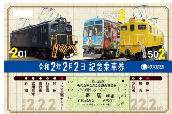
令和2年2月2日記念乗車券イメージ