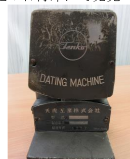
日付印字器（ダッチングマシン）