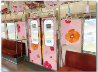
車内壁面イメージ