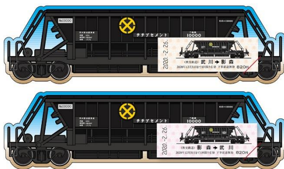
記念乗車券 2 種イメージ (台紙にセットしたイメージ)