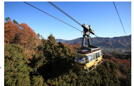
ロープウェイ イメージ

☆宝登山ロープウェイや宝登山小動物公園、長瀬ラインくんだりなど長瀬観光施設をお得に利用できる「ちちぶへおでかけキャンペーン」を実施中です。詳細は秩父鉄道ホームページをご確認ください。