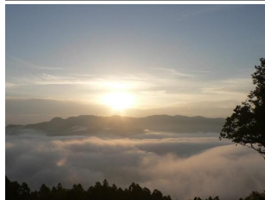
宝登山からの夕焼け・ 雲海イメージ