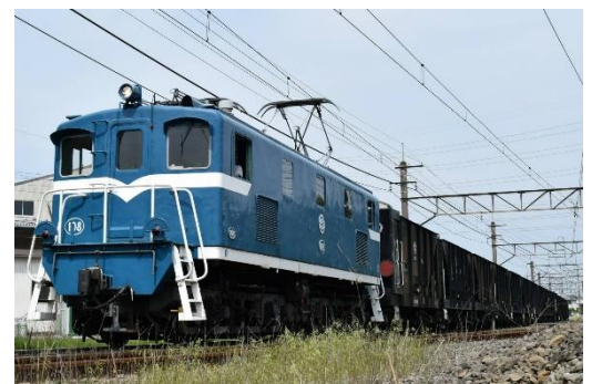
電気機関車108号機 イメージ

電気機関車108号機は1951年に製造され、1972年までの松尾鉱業鉄道全廃まで「ED502」として活躍しました。その後は秩父鉄道へ譲渡され、108号機として1973年から運用を開始し、貨物輸送を中心に活躍しましたが、2020年12月をもって引退します。