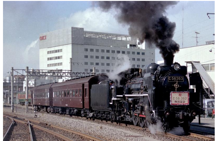
SL パレオエクスプレス復活当時のイメージ

C58363 (シゴハチ サンロクサン) 号機は、1944年2月19日川崎車両で製造された蒸気機関車で、現役時代は東北を中心に活躍しました。1972年に現役引退後は、吹上町立吹上小学校(現在の鴻巣市吹上小学校)の校庭で余生を送っていましたが、1988年3月開催のさいたま博覧会にあわせて「SL 運行を!」の声があがり、その大役にC58363が抜擢されました。引退から約15年間を経て秩父路を走る「SL パレオエクスプレス」として復活し、秩父路観光に欠かせない蒸気機関車として活躍中です。