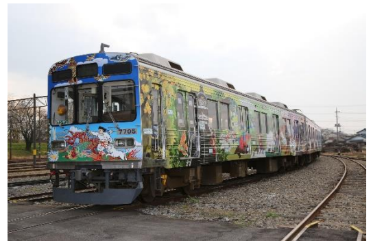
秩父三社トレインイメージ

※秩父三社トレインは神社の風景の特徴をデザイン化したもので、忠実に再現したものではありません。