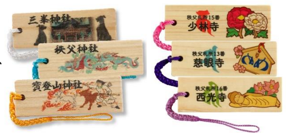
木札ストラップイメージ