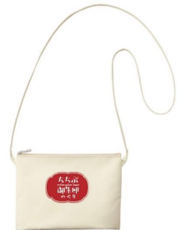
サコッシュイメージ